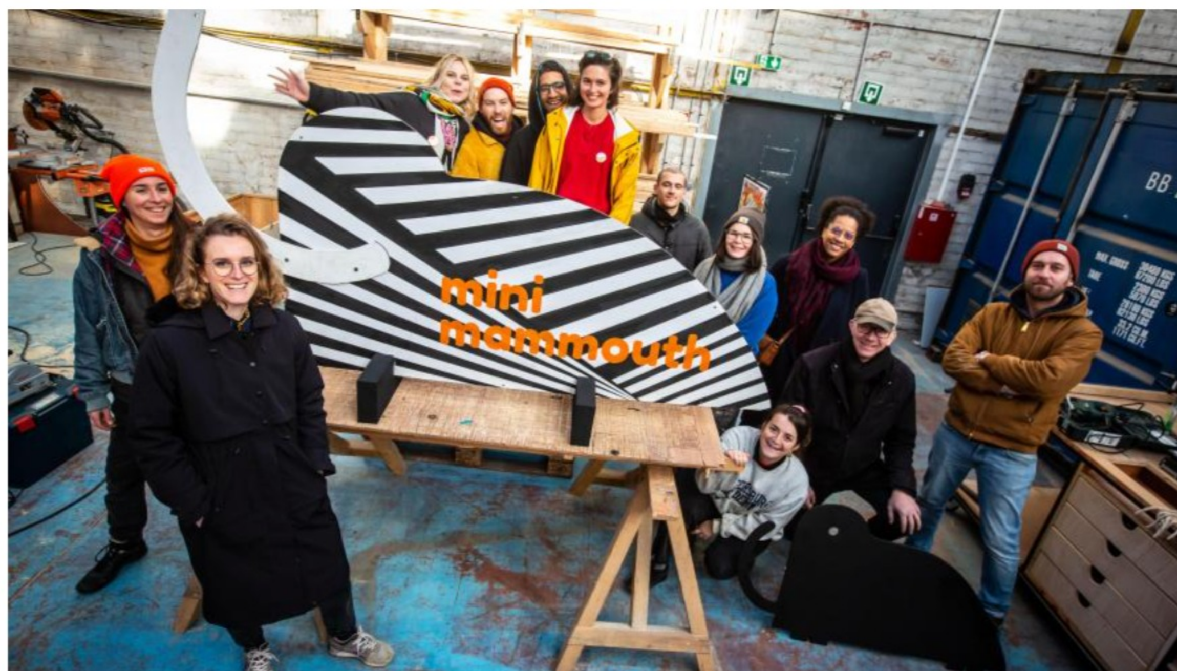
Vingt-quatre artistes locaux vendront quelques-unes de leurs créations lors de la supérette de l'art.

En panne d'idées cadeaux de Noël ? L'association d'artistes Fructôse rempile avec une neuvième édition de son supermarché de l'art, le week-end des 10 et 11 décembre. On vous propose de bonnes raisons d'y passer une tête.